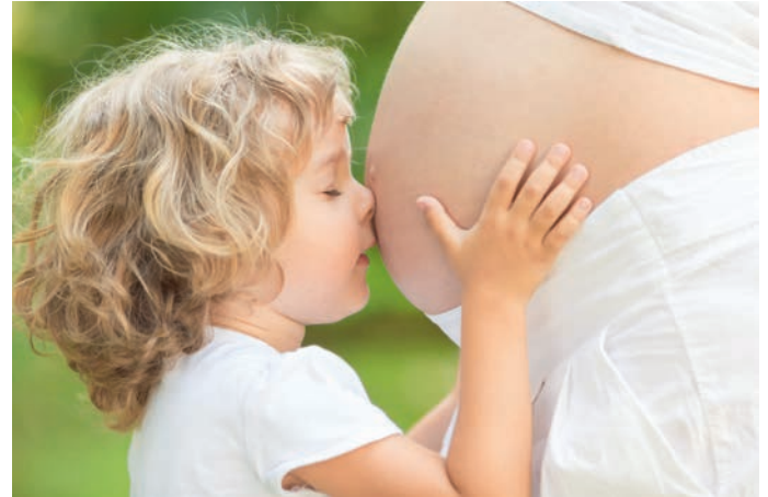
Vita Intense ist auch für Kinder und in der Schwangerschaft eine ideale Ergänzung.

Vita Intense dient zur vollwertigen Ergänzung für Erwachsene und Kinder, außerdem ist die Konzentration an Folsäure speziell auf den Bedarf in der Schwangerschaft angepasst. Dieses Produkt ist eine wertvolle Unterstützung für Menschen mit erhöhter physischer oder psychischer Belastung sowie Sportler. Durch die Süße aus Agavendicksaft eignet sich Vita Intense auch für Diabetiker. Sämtliche Inhaltsstoffe stammen aus pflanzlichen Quellen und sind damit auch für vegan lebende Menschen geeignet. Die empfohlene Tagesration ist eine Flaschenkappe und enthält eine dichte Konzentration an Vitaminen sowie eine Vielzahl an außergewöhnlichen, sekundären Pflanzenwirkstoffen und Antioxidantien. Ergänzung in Saft-Form hat zudem den Vorteil, dass die Vitalstoffe deutlich schneller ins Blut und zu den Zellen gelangen, als beim Verzehr von getrockneten Wirkstoffen. Vita Intense ist somit die ideale Ergänzung für eine gesunde Ernährung.