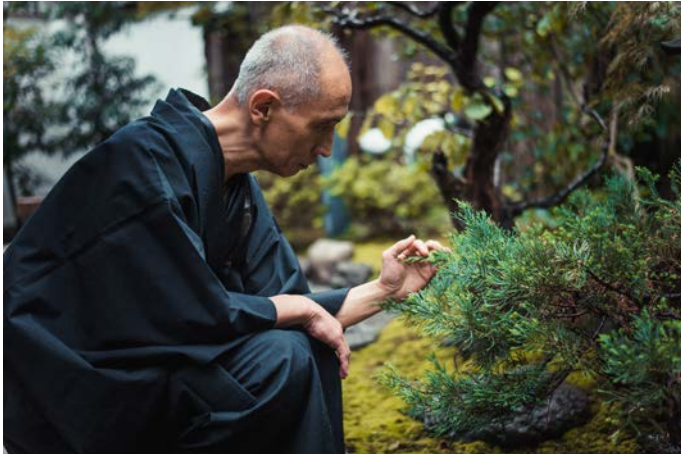
Grüner Tee war ein fixer Bestandteil der traditionellen japanischen Ernährung und führte zu Gesundheit und Langlebigkeit.

in ihrer Wirkung. Zudem unterstützt lebensbegleitendes Detox mit Vita Pure die Aufnahme von Mikronährstoffen im Darm.