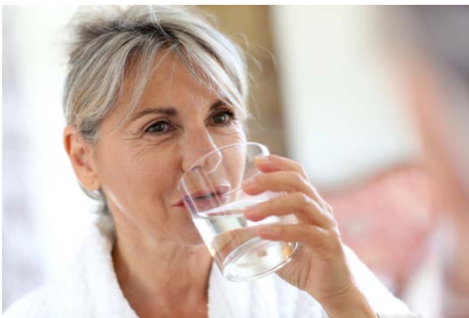
Das Silizium in Vita Pure stärkt das Bindegewebe und hilft die Jugendlichkeit des Körpers zu bewahren.

Das Vulkangestein in Vita Pure ist ein Alumosilikat und beinhaltet Silizium. Dieses Mineral hat besondere Bedeutung in der Regeneration des Bindegewebes. Es wird vom Körper als Siliziumdioxid aufgenommen und verlangsamt Alterungsprozesse wie Faltenbildung. Es verhilft zu kräftigen Nägeln und Haaren sowie zu straffem Gewebe. Der Siliziumgehalt im Blut nimmt ab dem jungen Erwachsenenalter kontinuierlich ab und sollte lebensbegleitend zugeführt werden, insbesondere von der Generation 50-plus.