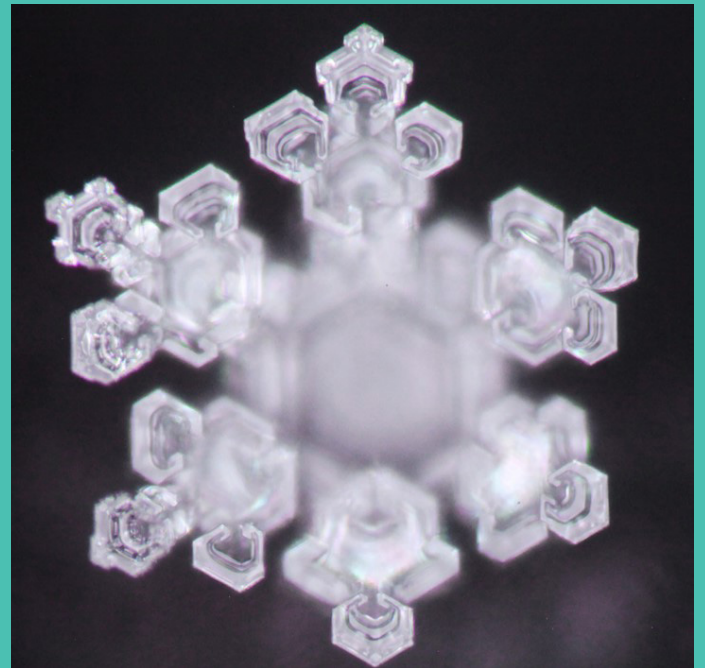
Die LavaVitae-Veredelung hebt das Ordnungsniveau der Produkte, die Kristalle werden schöner und kraftvoller