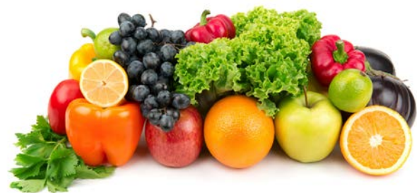
Biologisch gewonnene Lebensmittel haben mehr Lebenskraft