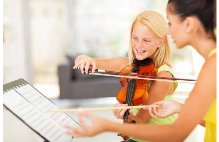
Harmonische Klänge und freundliche Botschaften erzeugen schöne Wasserkristalle